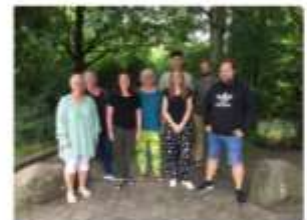
Ballekolleens SFO 21-22 'Fritidshuset'